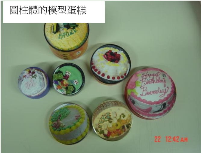
圓柱體的模型蛋糕